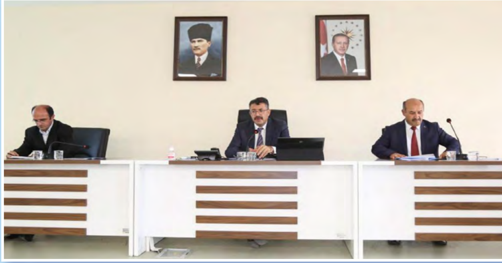
Toplantı, Valimiz Sayın Ali ÇELİK başkanlığında, Valilik Toplantı Salonunda gerçekleştirildi.

İlimizde çocuklara trafik bilinci kazandırılması için harekete geçildi. Bu kapsamda Valilik Toplantı Salonunda Valimiz Sayın Ali ÇELİK başkanlığında, "Çocuk Trafik Eğitim Parkları Koordinasyon Toplantısı" yapıldı.