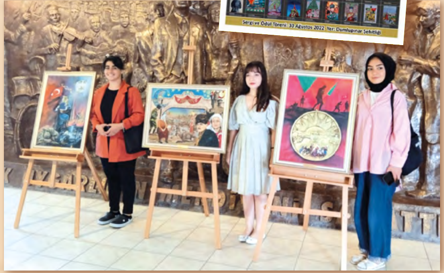
Yarışmada dereceye giren öğrencilerimiz.