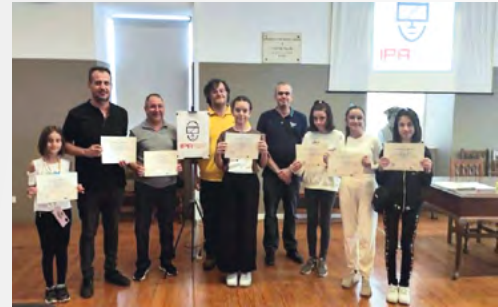
Gediz Altinkent Ortaokulu'nun Portekiz hareketliliğinden bir kare