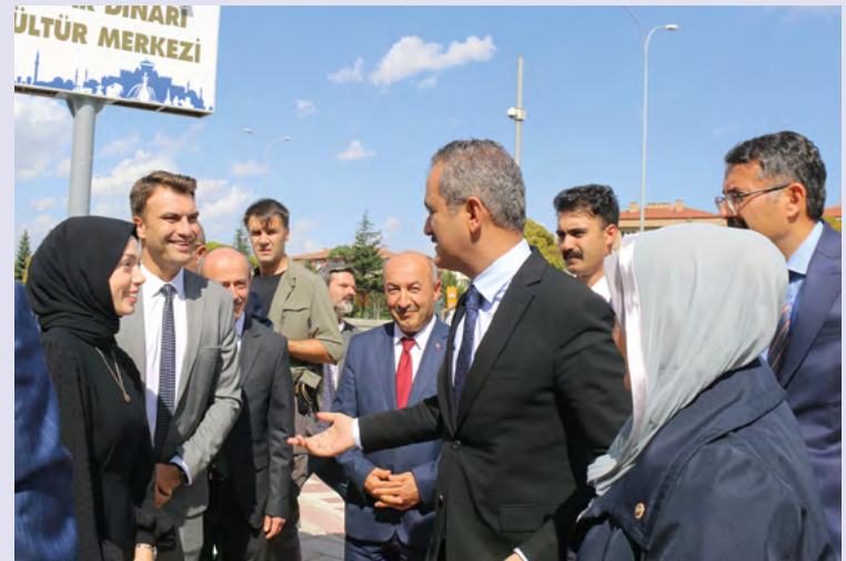
Millî Eğitim Bakanımız Sayın Prof. Dr. Mahmut Özer program öncesinde öğretmenlerle kısa bir sohbet gerçekleştirdi.