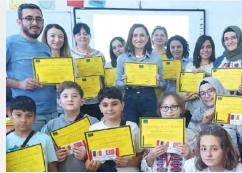
Gediz 1 Eylül İmam Hatip Ortaokulu'nun Romanya hareketliliğinden bir kare

Son olarak, Kütahya İl Milli Eğitim Müdürlüğü Akreditasyon programı kapsamında yürütülen Erasmus+ İşbaşı Gözlem Hareketliliği projesinde ise ilçemizde Gediz Atatürk Ortaokulu yer almakta olup bu kapsamda 18-27 Ekim 2022 tarihleri arasında okuldan bir öğretmen Almanya'da; 11-17 Kasım 2022 tarihlerinde ise bir öğretmen Yunanistan'da bulunacaklardır.