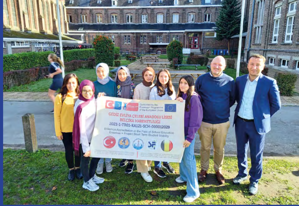
Gediz Evliya Çelebi Anadolu Lisesi'nin Belçika hareketliliğinden bir kare

K ütahya İl Milli Eğitim Müdürlüğü Akreditasyon programı kapsamında yürütülen Erasmus+ Öğrenci Hareketliliği projesinde ilçemizden ortak olan okullarımız Gediz 1 Eylül İmam Hatip Ortaokulu ve Gediz Evliya Çelebi Anadolu Lisesi proje ekipleri, Romanya ve Belçika Hareketliliklerini tamamladı. Gediz 1 Eylül İmam Hatip Ortaokulu 6 öğrenci ve 2 refakatçi öğretmenle beraber Romanya'da 25-30 Eylül 2022 tarihleri arasında bir hafta süreyle proje kapsamında çeşitli etkinlikler gerçekleştirdi. Gediz Evliya Çelebi Anadolu Lisesi 6 öğrenci ve 2 refakatçi öğretmenle beraber Belçika'da 2-7 Ekim 2022 tarihleri arasında bir hafta süreyle proje kapsamında çeşitli etkinlikler gerçekleştirdi.