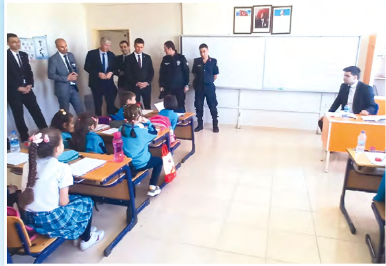
Protokol üyeleri derslikleri dolaşarak öğrencilere başarılar diledi.

Ardından derslikleri dolaşan protokol üyeleri, öğrencilere başarılar diledi.