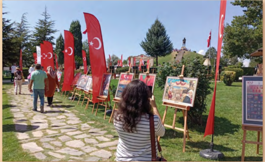
Dumlupınar Şehitliği'nde gün boyu açık kalan sergiye ziyaretçiler yoğun ilgi gösterdi.