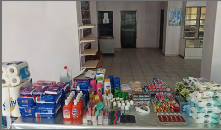
Kırkklar Kız AIHL