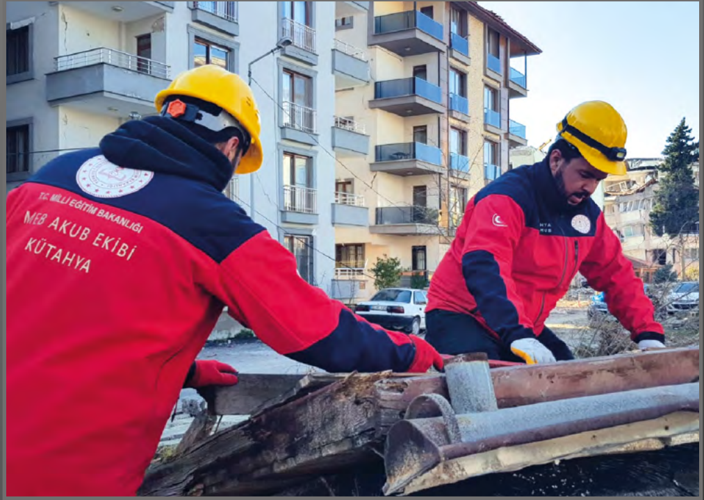
İl Millî Eğitim Müdürlüğü AKUB ekibi arama kurtarma çalışması yaptı.