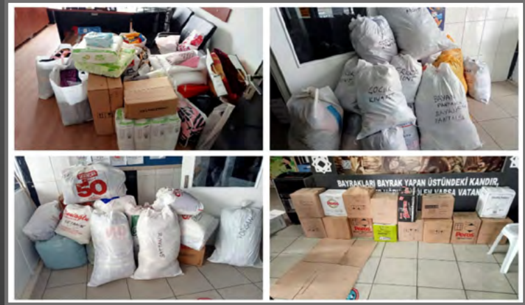
Tavşanlı 75. Yıl Ortaokulu