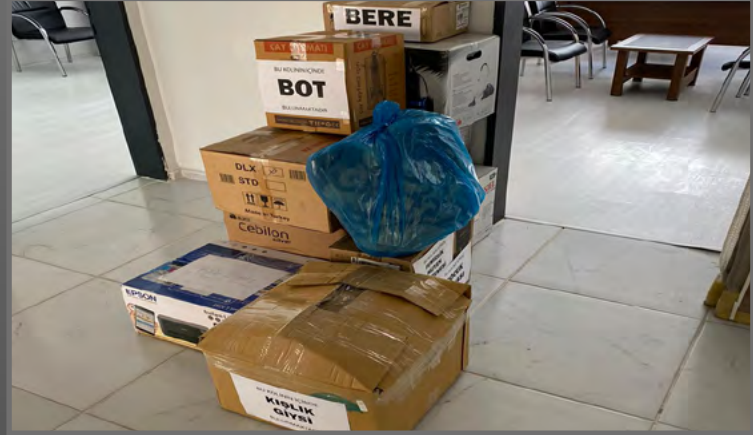
30 Ağustos Anaokulu