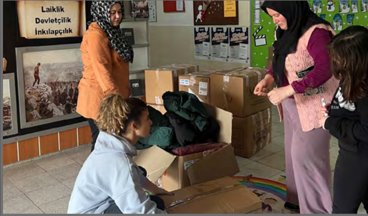
Ticaret Borsası Bölcek İlk/Ortaokulu