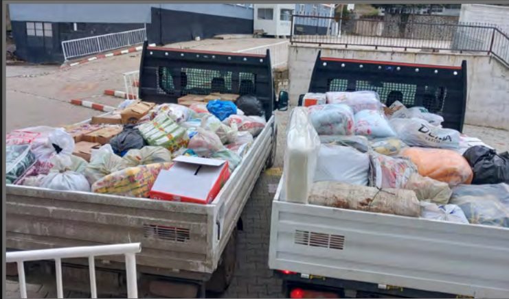
Tavşanlı Balıköy İlk/Ortaokulu